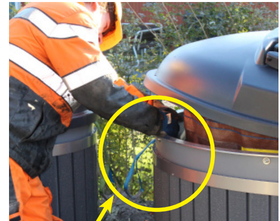
Kuva 2. Nostolenkkien poisto