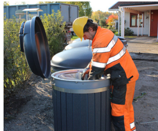
Kuva 3. Säkkien avaaminen, suoristaminen ja paikalleen laitto