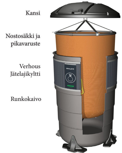
Kuva 1. Säiliön rakenne