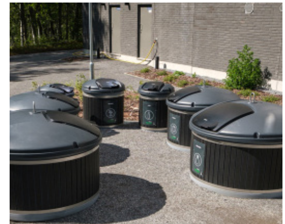
Kuva 4. Valmis, siisti jättepiste

Mikäli asennusta ei ole tehty Molok Oy:n antamien ohjeiden ja suositusten mukaisesti, asentaja on korvausvelvollinen asennuksiin liittyvissä reklamaatiotapauksissa. Molok Oy ei vastaa tämän asennusohjeen ja suositusten vastaisten asennusten aiheuttamista vaurioista eikä kustannuksista.