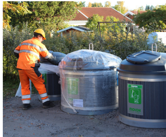
Kuva 1. Suojamuovien poisto